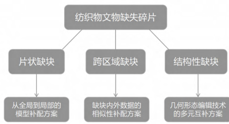
&gt; 图3 纺织品的文物缺失碎片及相应数字化修复方案